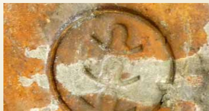
obr. č.: 4 - bobrovky z obce Kout

Na dohled od Domažlic leží i obec Kout, kde se vyráběly bobrovky, které se označovaly kulatým razítkem s třemi klobouky (obr.4). Bobrovky z Poběžovic zase měly vyražený nádherný zámecký znak (obr.5). Poslední známou regionální cihelnou je cihelna v Kolovči, která produkovala falcovky se signaturou J.KUBÁT.-KOLOVEČ. (obr.6).