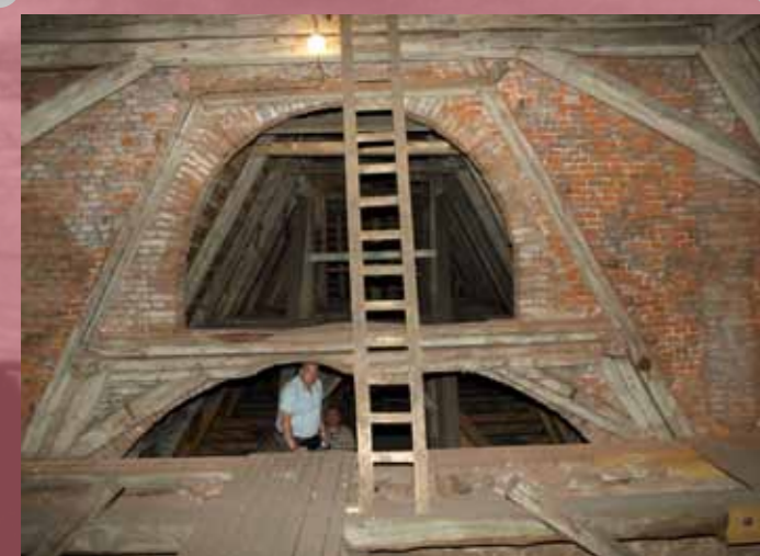
obr. č.2. pohled do krovu kostela

tupnění. Na první pohled nás zaujali rozsáhlé prostory půd, které již v době svého vzniku zadávali možnost k „půdním vestavbám“. Samozřejmostí je velmi hezké řemeslné zpracování krovu a začlenění trámů i o délce až 20ti metrů, což muselo být vzhledem k absenci těžké mechanizace značně fyzicky i řemeslně náročné. Každý z trámů je značen římskými číslicemi, jak bylo a někde ještě je obvyklé. Tam kde končili znalosti tehdejších mistrů a tovaryšů jsou číslice „běžné“ nahrazeny novotvary s mnoha X a I, tak aby bylo řazení trámů zřetelné.