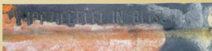
obr. č.: 3 - falcovky Dampfziegelei in Blisowa

V 20 km vzdáleném Staňkově probíhala až do druhé světové války výroba tašek průmyslníka Kreysy (díl č.2 našeho seriálu). V Blížejově, který leží 10 km od Domažlic, se již v 19. století vyráběly falcovky s vyraženým nápisem Dampfziegelei in Blisowa (obr. 3). Zajímavostí těchto tašek byl i uváděný údaj o datu výroby, který byl na každé tašce. V naší sbírce je tak zachováno mnoho tašek z různých let začátku minulého století. Zajímavostí je i pracovní řád cihelny z roku 1898.