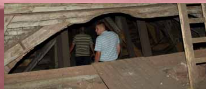
obr. č.5 prolézání krovu kostela