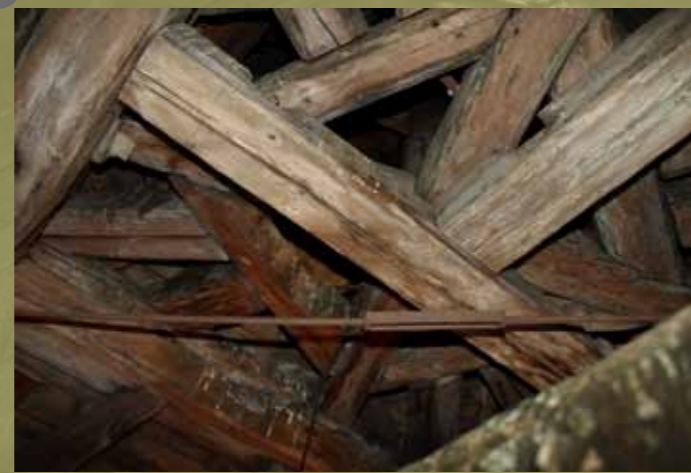
obr. č.3. krov zvonice

podobných objektech nachází. Vše nám ale opět vynahradila zvonice, která je doposud osazena zřejmě původním zvonem.