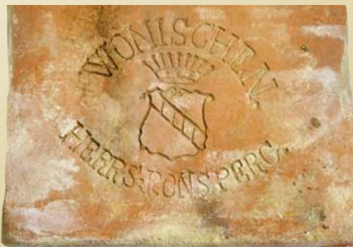
obr. č.: 5 - znak bobrovky z Poběžovic

Z dnešního pohledu je neuvěřitelné, že do dvaceti kilometrů od Domažlic bylo za první republiky minimálně 7 cihelen, které prosperovaly. Největšího věhlasu v té době dosáhly tašky firmy J.Milota z Domažlic a tašky ze Staňkova od firmy Kreysa. Nicméně tašky ze všech zmíněných cihelen jsou dodnes na střeších a většinou celkem dobře plní svoji funkci.