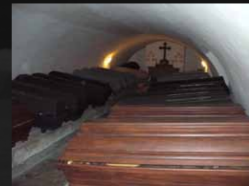
obr. č.7 krypta hrobky

V případě Vašeho zájmu se těšíme i na informace od Vás, popřípadě na nabídky prohlídek „tajemných“ zákoutí ve Vašem okolí. Vaše náměty nebo články zasílejte na email: vaclav.kucaba@dachdecker.cz