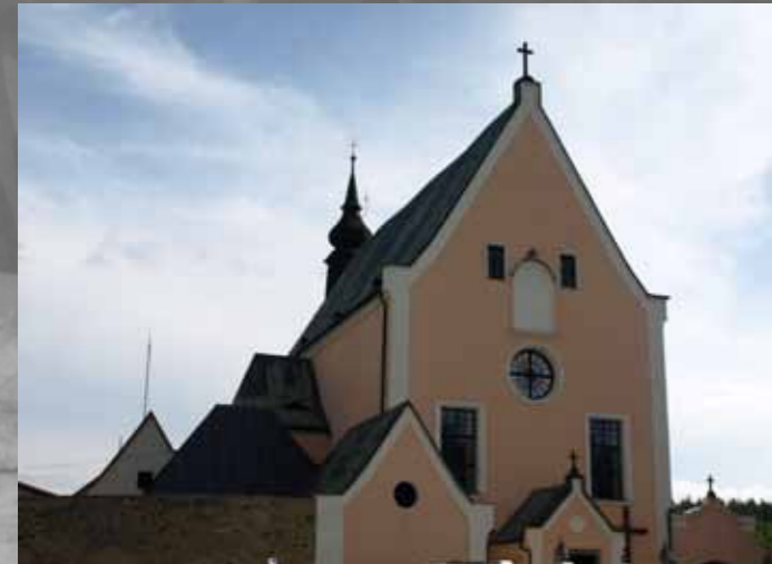
obr. č.1 východní pohled na klášter s lodí kostela sv. Antonína

Jak jsme v minulém čísle slíbily, vydáváme se s Vámi opět na tajemné výpravy po našem okolí. Možná jako jedni z posledních jsme navštívily staré půdy Kapucínského kláštera s kostelem sv. Antonína Paduánského v Sokolově (obr. č. 1). Protože vzhledem k vybudování nového pivovaru v areálu kláštera došlo k přesunutí archivu do půdních prostor a tím i zneprís-