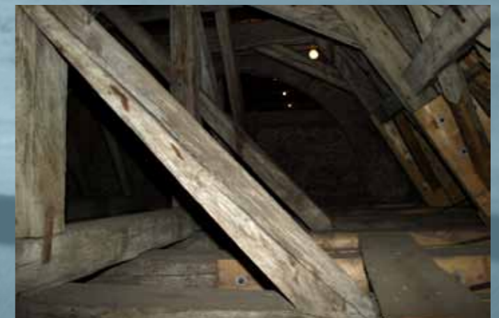
obr. č.5 půdní prostory kláštera