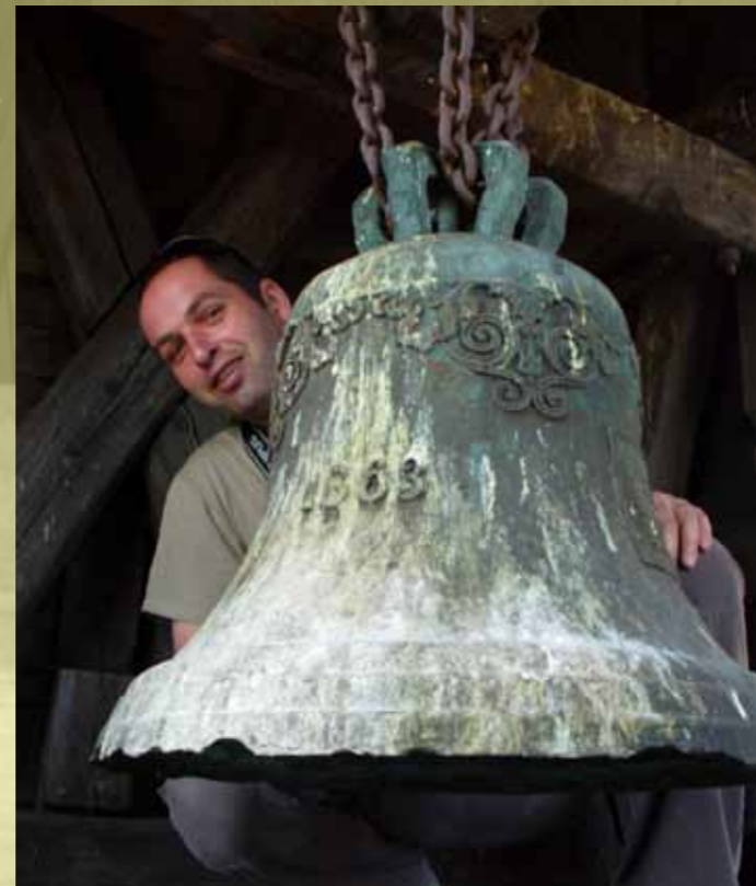
obr. č.4. zvon kostela