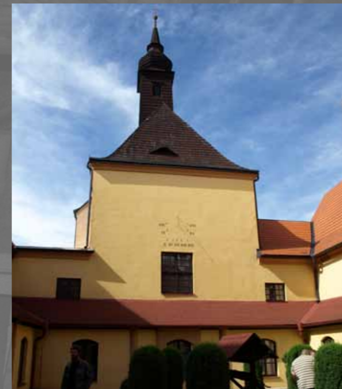
obr. č.6 dvorana kláštera - západní pohled na kostel

Jako i mnohokrát dříve jsme neodolali a pro štěstí jsme si na zvon zazvonily.