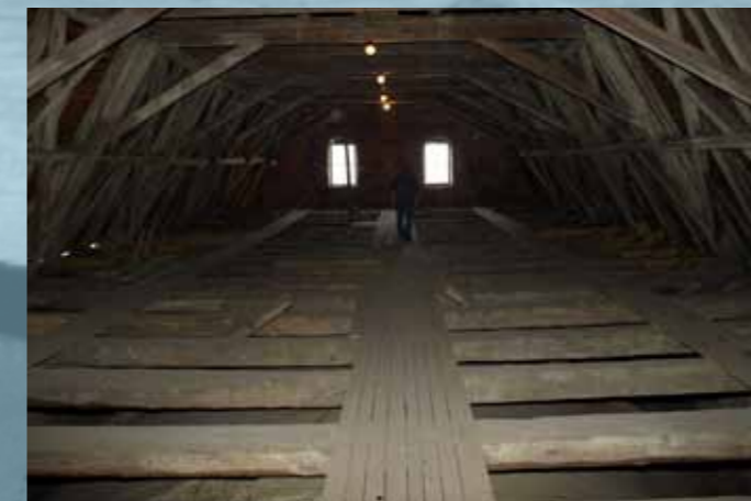
obr. č.5 půdní prostory kláštera