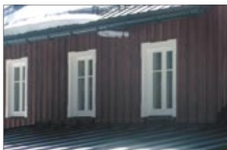
Obr. č. 4 duben 2006