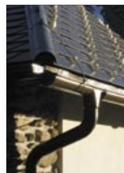
Obr. č. 7 Kubova Huť

Závěrem jen malá poznámka: je samozřejmostí, že specializovaní prodejci střech jakými jsou Dachdecker a PRVNÍ CHODSKÁ mají ve svém sortimentu PREFU. Navíc však u nich můžete využít profilování svitkových plechů, ohýbání na přesné míry a rychlé dodávky okapových systémů.