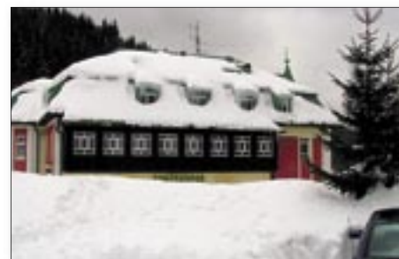
Obr. č. 5 Pec p. Sněžkou leden 2006

Větrací tašky ke všem modelům PREFY jsou samozřejmě k dispozici. Všichni však víme co dokáže prachový sníh natropit, dostane-li se do odvětrávací mezery. Hřeben Jet Lüfter dokáže odvětrat sám vzduchovou mezeru tvořenou kontralatí až 5 cm. Je konstruován tak, aby většina prachového sněhu prolétla ze střechy ven. Perfektně fungující odvětraná střecha na hotelu Hořec v Peci. (obr. 5 a 6)