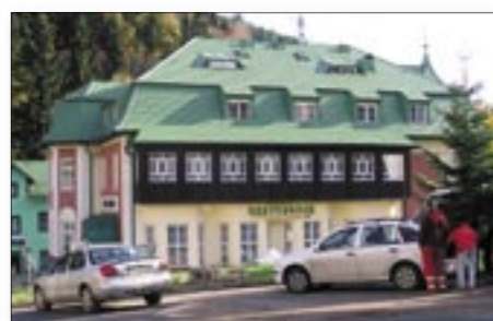
Obr. č. 6 Pec p. Sněžkou duben 2006