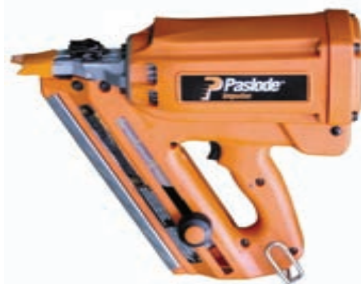
ITW PASSLODE str. 11