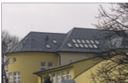
Obr. 1 Okna Velux ve Frýdlantu n.O.

V Třeboni jsem letos o vánocích v souvislosti se zatím mírnou zimou slyšel pěkné přísloví: „Finančák a únor nikomu nic neodpustí“. Myslím, že je to trefné, nenechme se ukolébat pár teplými týdny. Již několik let mám co do činění se střechami PREFA a čím dál tím víc s uvědomuji, že příroda nám opravdu nechce nic odpouštět. A čím dál tím víc si vážím zásad PREFY v technické a výrobní oblasti. To, co prošlo prověrkou v nejvyšších polohách Alp, je stejně nekompromisně prosazováno i v nížinách. Nemusím ani připomínat, že ten, kdo dělal střechy s PREFOU, mohl v loňské zimě klidně spát. Skutečně nám neodešel ani jeden žlab, neprotekla žádná střecha. Pokusím se zamyslet nad tím, proč tomu tak je.