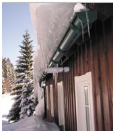
Obr. č. 3 leden 2006

vydal Čech KPT. Dimenze žlabového háku je již „jen“ na výrobcí. Kdo si zkusil pevnost háků PREFA, ví o čem hovořím. Pro řadu střech jsou potřeba prodloužené háky. Specialitou PREFY jsou horské háky (zatím jen v rozměru 333). O tom, co vydrží, se můžete přesvědčit z obrázkem č. 3. Byl pořízen v lednu 2006. Na jaře led roztál a jak vypadal ten samý žlab, je vidět na snímku č. 4.